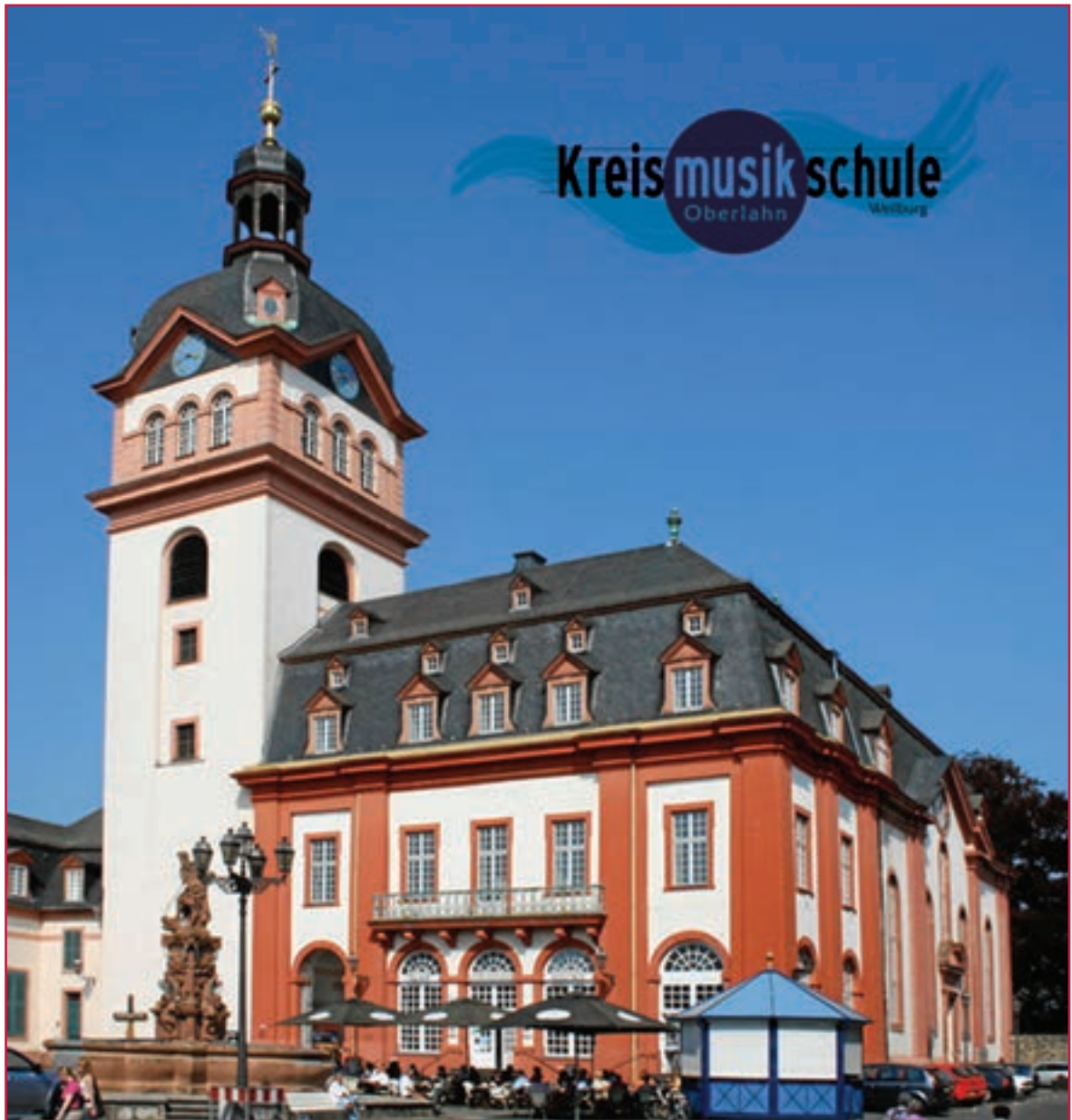
Partnerská škola vo Weilburgu, Nemecko