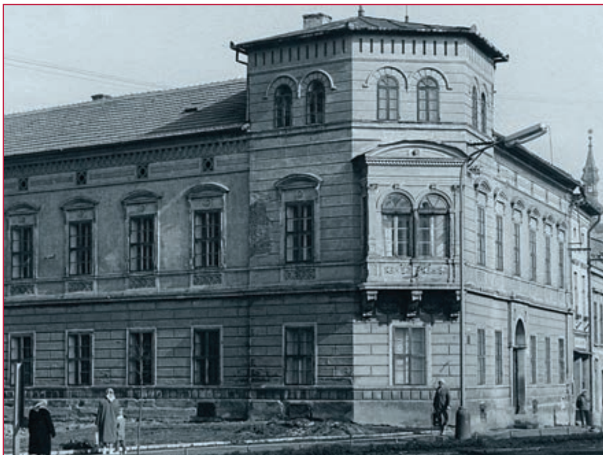
Hlavná budova Základnej umeleckej školy A. Cígera v päťdesiatych rokoch