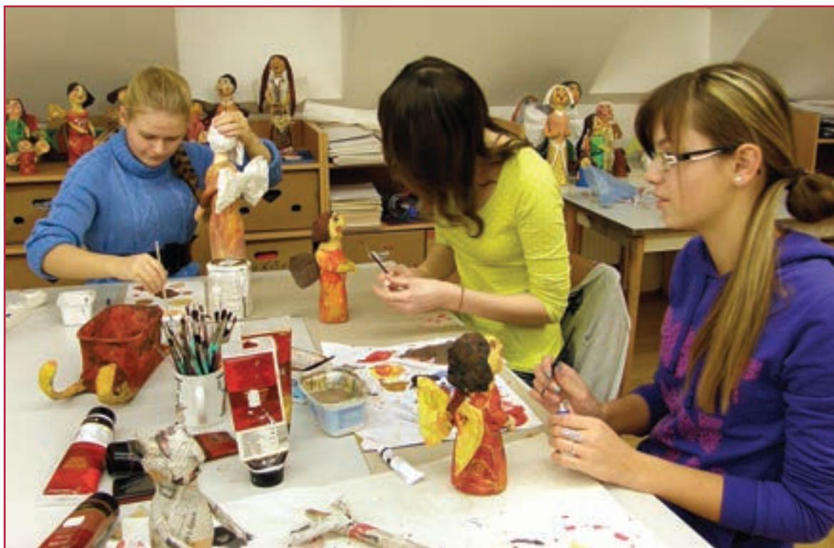
Žiačky výtvarného odboru pri práci