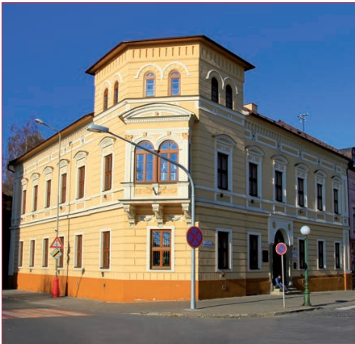
Hlavná budova Základnej umeleckej školy A. Cígera dnes