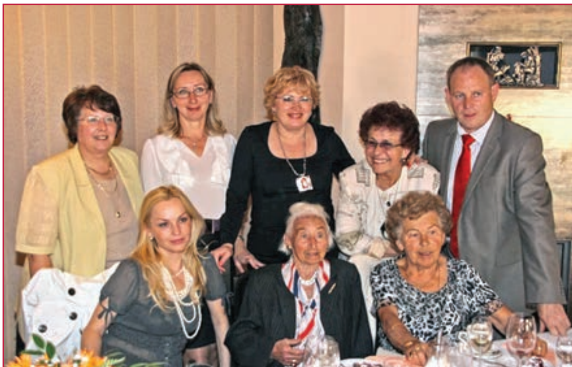
Stretnutie s kolegyňami, 2010