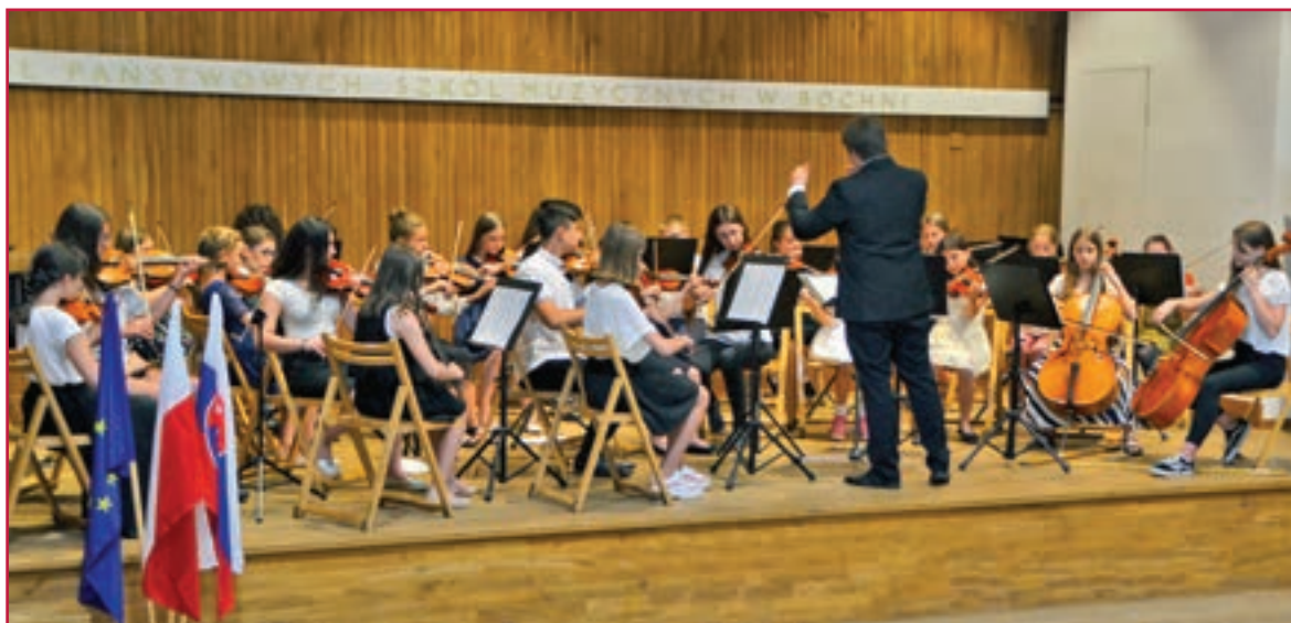
Závěrečný koncert Na strunách