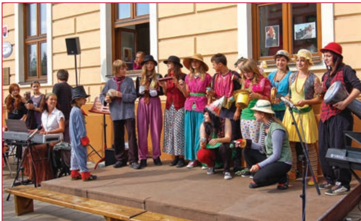
Prezentácia žiakov literárno-dramatického odboru