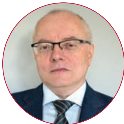
Krzysztof Mieczysław Krawczyk