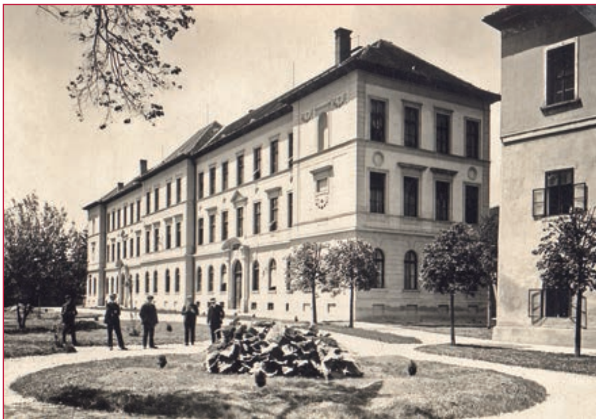
Budova nemeckého gymnázia