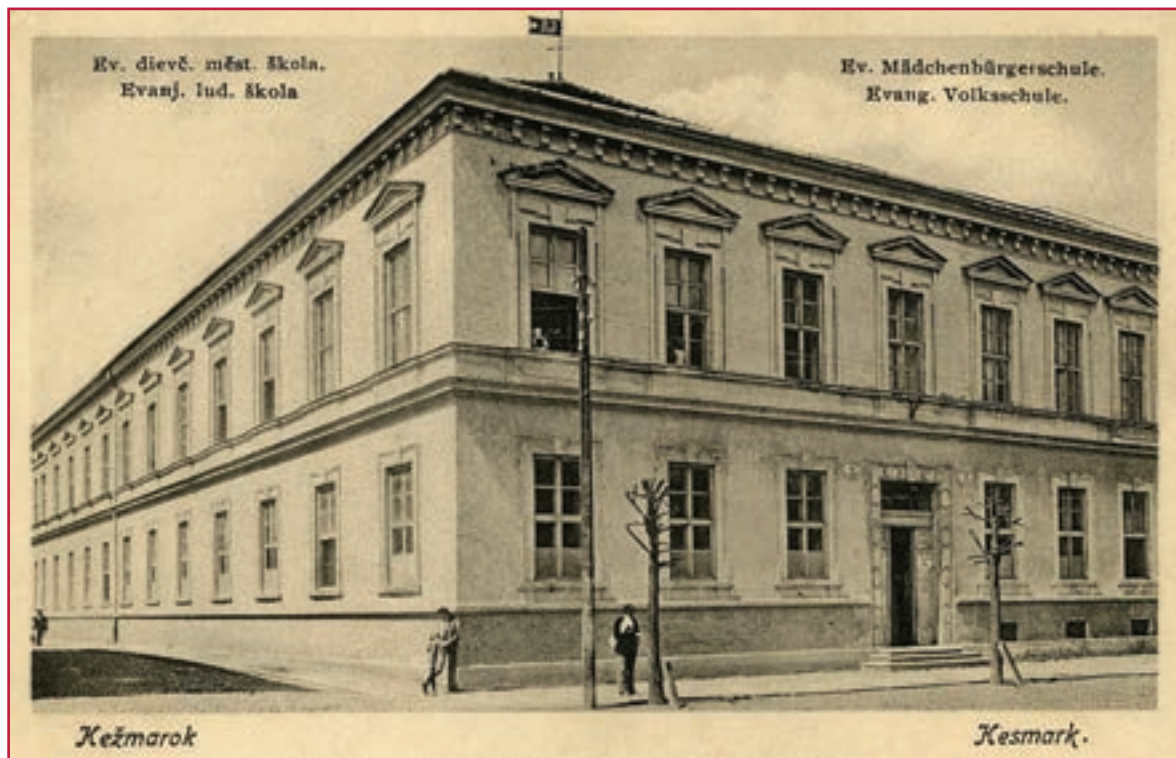
Musikschule v budove Evanjelickej dievčenskej meštianskej školy