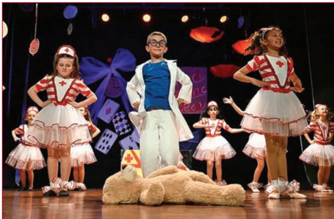
Vystúpenie žiakov tanečného odboru