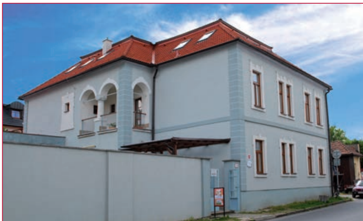
Budova Základnej umeleckej školy A. Cígera na Kostolnom námestí