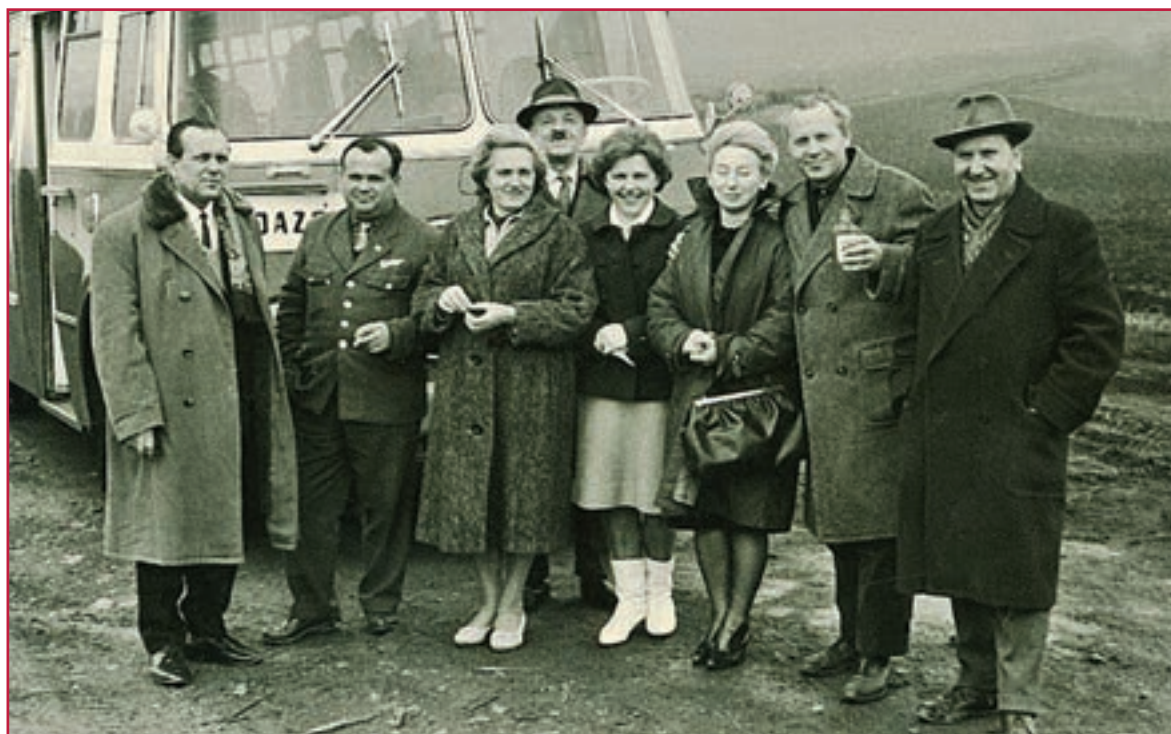
Kolektív učiteľov v šesťdesiatych rokoch