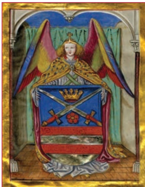
Erb mesta Kežmarok, 1463