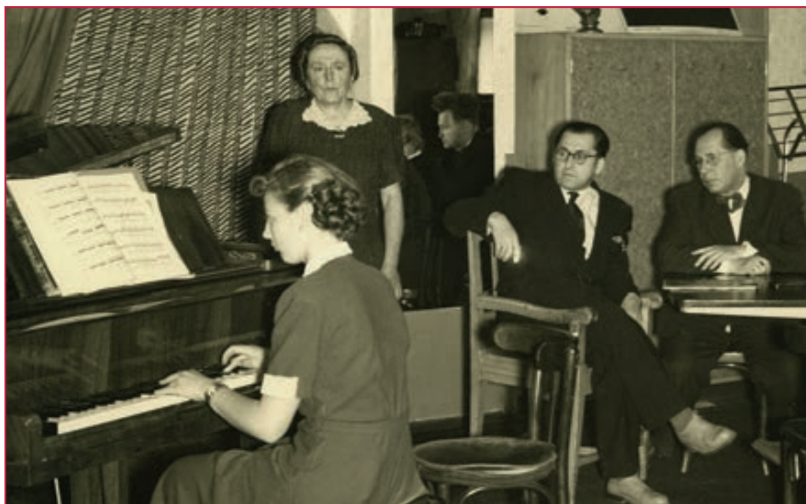
Závěrečné skúšky žiakov