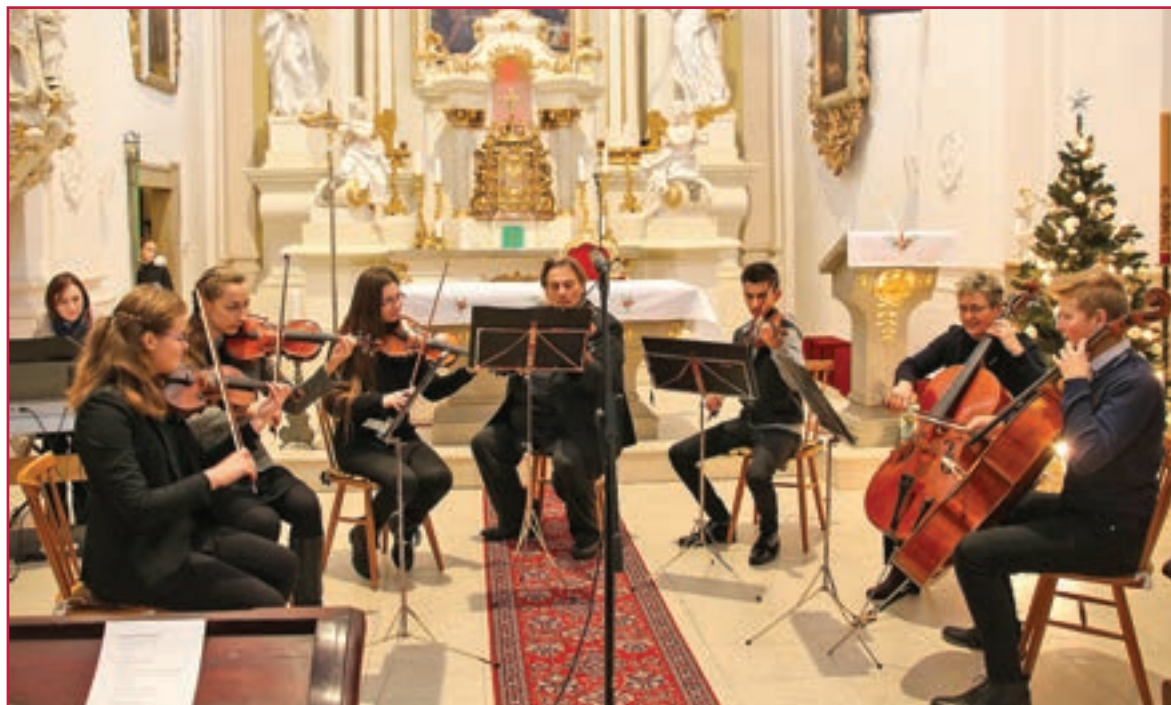
Koncer sláčikového orchestra v Mariánskom kostole na Hradnom námestí