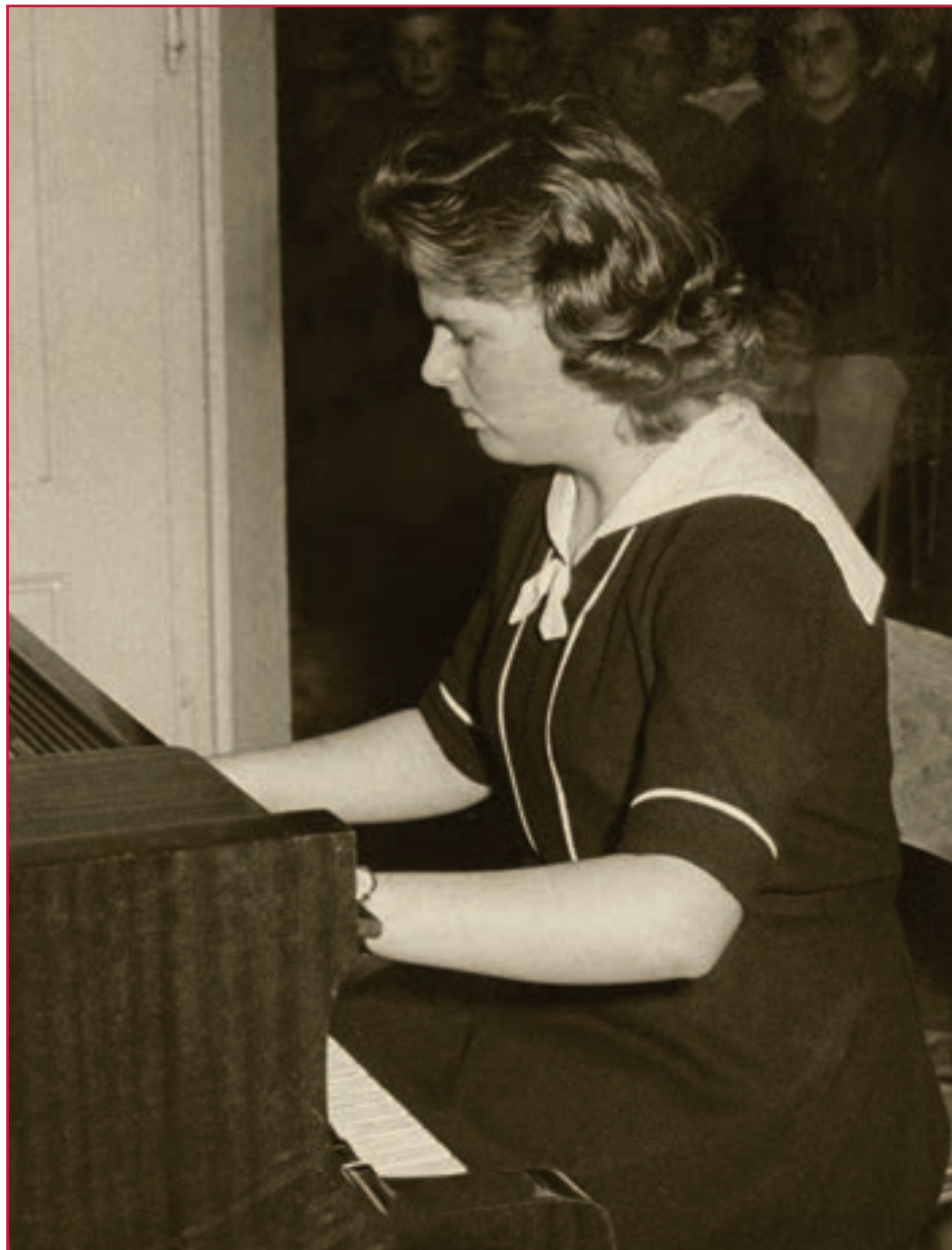
Triedny koncert Sylvie Vargovej (Holopovej), 1961