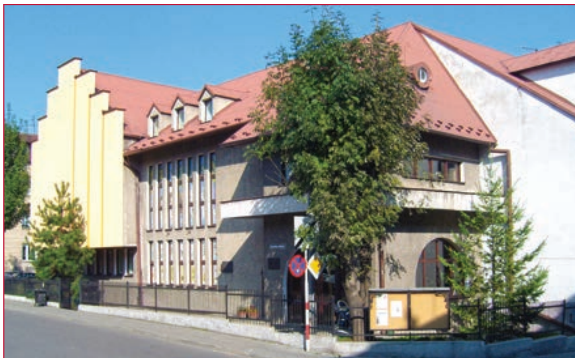
Partnerská škola v Bochni, Polsko