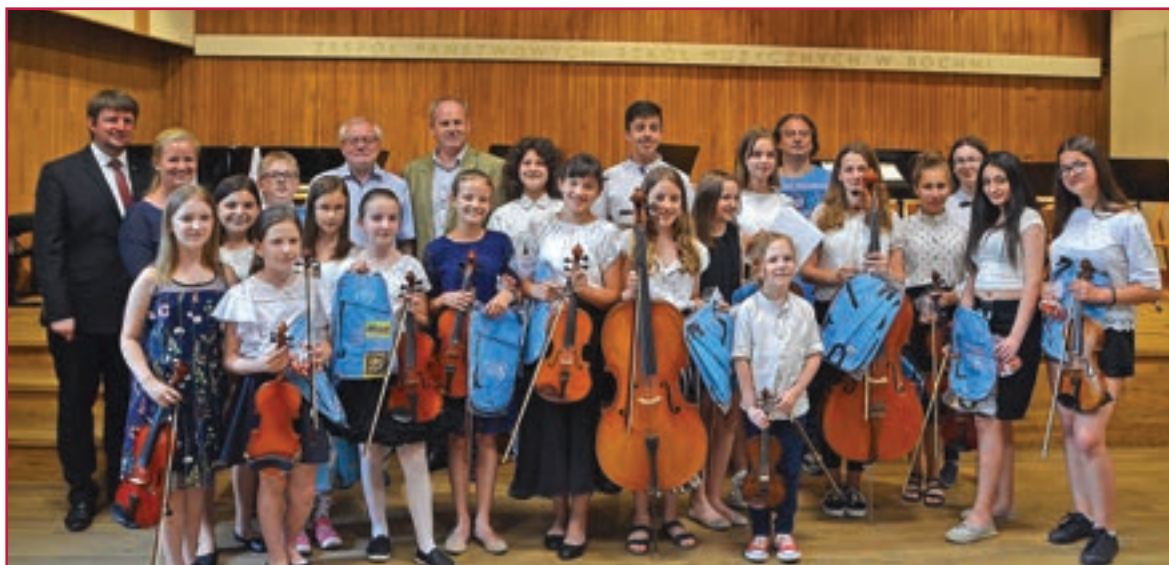
Radost po odohratí koncertu