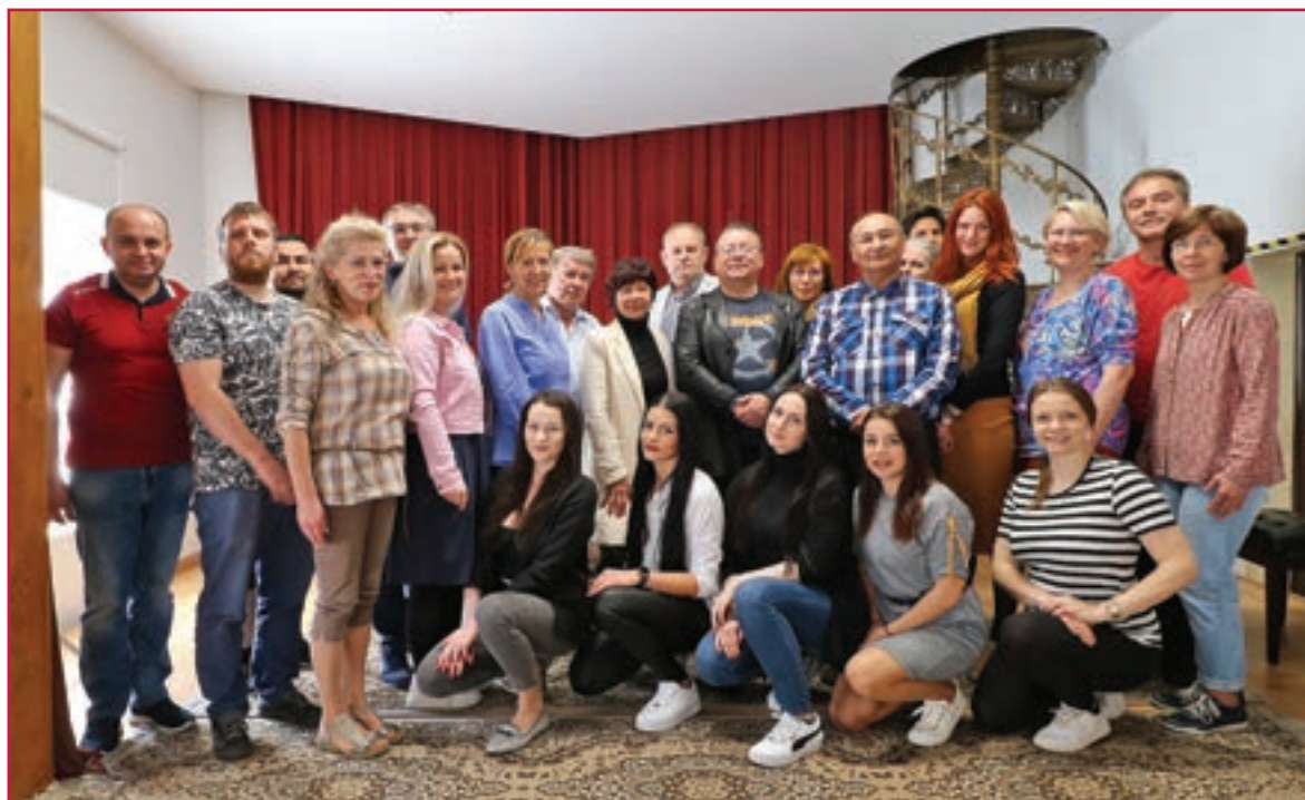
Súčasný kolektív pedagógov školy